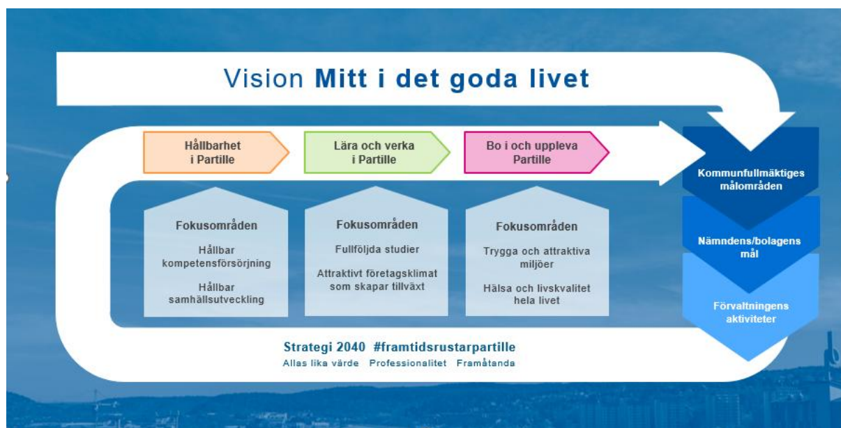
Kommunkoncernens styrmodell med mål och fokusområden

Partille kommun ska vara en ekonomiskt, miljömässigt och socialt hållbar kommun. Den ekonomiska, miljömässiga och sociala hållbarheten samlas under de verksamhetsmässiga målområdena, vilka vi finner i kommunens vision ”mitt i det goda livet”. Uppföljning av nämndernas verksamhetsmässiga målområden görs i respektive nämnds årsredovisning. God ekonomisk hushållning följs upp i hel- och delårsrapporten.