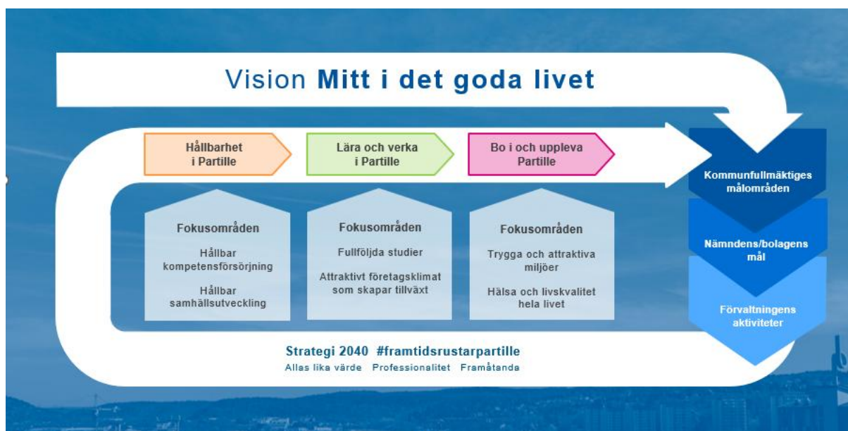
Kommunenkoncernens styrmodell med mål- och fokusområden

Partille kommun ska vara en ekonomiskt, miljömässigt och socialt hållbar kommun. Den ekonomiska, miljömässiga och sociala hållbarheten samlas under de verksamhetsmässiga målområdena, vilka vi finner i kommunens vision ”mitt i det goda livet”. Uppföljning av nämndernas verksamhetsmässiga målområden görs i respektive nämnds årsredovisning. God ekonomisk hushållning följs upp i hel- och delårsrapporten.